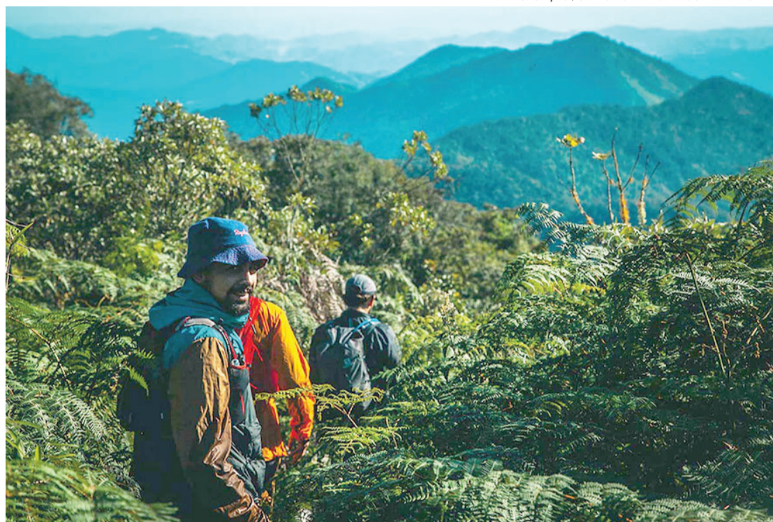
Atividade de caminhada reunirá um grupo seleto de atletas durante o evento

Parece até repetitivo escrever ou comentar sobre os potenciais naturais e esportivos de Nova Friburgo. Mas é sempre válido destacá-los e, sempre que possível, uni-los em torno de um mesmo propósito. E será exatamente inspirado nos maiores eventos de montanha da Europa que o Free Mountain Festival promove sua edição de 2021 a partir desta sexta-feira, 16. Estão programadas no município diversas atividades ao ar livre, cinema open air, palestras sobre meio ambiente e tudo o que faz parte do universo outdoor. Uma verdadeira comunhão entre natureza, conhecimento e aventura.