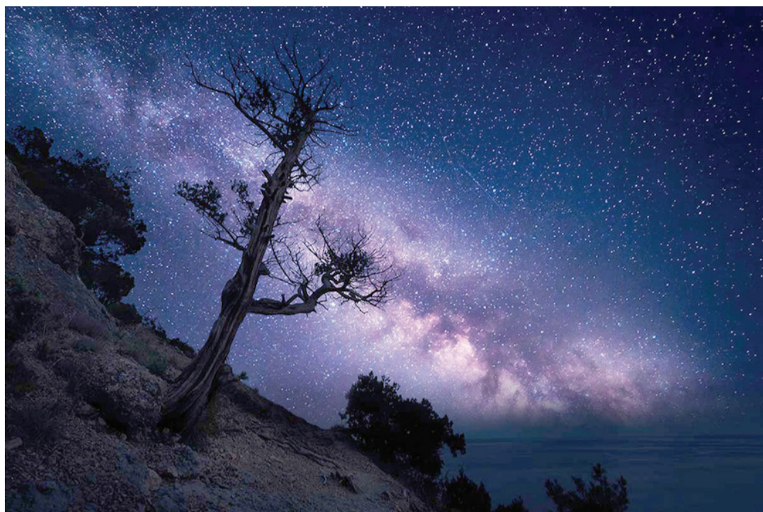
Potencial natural para a fotografia de astros em Nova Friburgo será explorado no festival