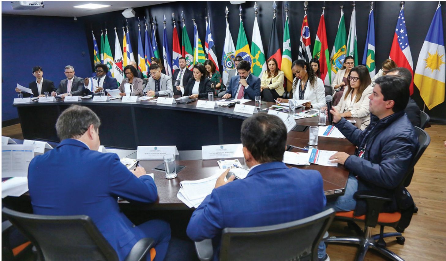
Estruturação do Sistema Nacional do Esporte foi uma das propostas apresentadas no encontro

A 59ª reunião ordinária do Conselho Nacional do Esporte (CNE) foi realizada na terça-feira, 8, no Ministério do Esporte, em Brasília. Com uma pauta ampla e estratégica, o encontro reuniu representantes do setor esportivo brasileiro para deliberar ações fundamentais para o fortalecimento das políticas públicas