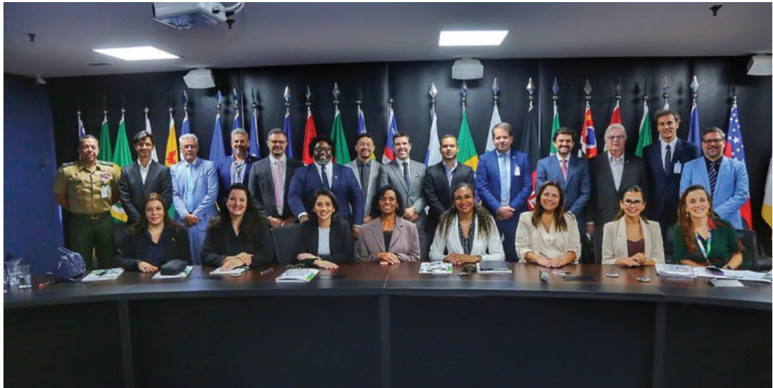
Integrantes do Conselho Nacional do Esporte se reuniram para importantes deliberações

e de transparência”, afirmou. Representando o COB, o presidente Marcos La Porta reforçou a importância do CNE como instância de articulação estratégica para o futuro do esporte brasileiro. “O Conselho é mais do que um órgão para aprovação de contas. É um espaço de debate sobre os caminhos que queremos trilhar. Uma medalha olímpica começa com o esforço conjunto de todos. Por isso, nossa presença visa fortalecer essa rede de diálogo e cooperação”, disse. Ao final do encontro, foi apresentada ainda a proposta de estruturação do Sistema Nacional do Esporte (Sinesp), com destaque para a criação de uma base unificada de informações esportivas do país. O processo já está em curso com o levantamento de dados nos estados e municípios, com o objetivo de subsidiar a formulação de políticas públicas mais eficazes e integradas.